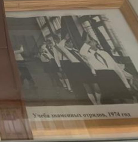
Учеба замесных отрядов, 1974 год