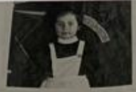
Октябртны, не тубоу - В литеры держиси пути! 1971-1972 уч. год