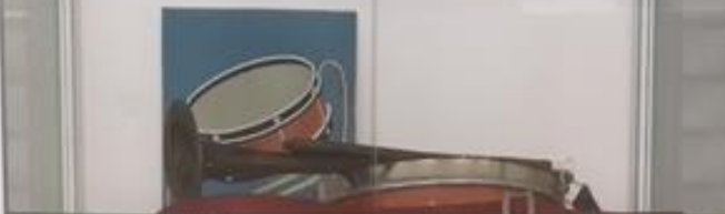
Ученицы Хороших Сабун